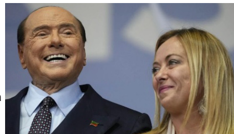
Sarà Meloni l'erede di Berlusconi?

Il disegno europeo collima con quello italiano. Mentre Salvini indugia, qui e là, in insistite derive sovraniste o pseudo-tali, la Meloni concede alla propaganda sporadiche escursioni verbali, adoperandosi sotto traccia alla finalità opposta: radunare attorno a sé il popolo buonsensista della destra-centro, convincendolo a quest'approdo a causa dell'inconsistenza delle alternative. Va dunque profilandosi il tentativo di creare una sorta di Partito repubblicano di massa, giusto l'idea che fu di Silvio, talvolta esportata nel mondo durante gli incontri coi Grandi del pianeta. Italians, Republicans . Permeata, l'idea, da un liberalismo ignoto alle Meloni delle origini, e che però neppure il fondatore di Forza Italia riuscì a trasmettere alle sue file, ai suoi fans, al suo blocco sociale. Lei ha il tempo di provarci, scordata l'affezione statalista dei post-missini. Lo spirito manovriero non sembra difettarle.