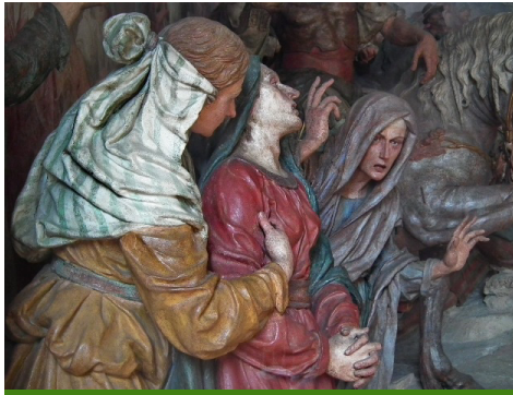
Sacro Monte di Varese, X Cappella, particolare

Non è parola di uomo: viene dal volto insanguinato, mite e umile, abbandonato al volere divino.