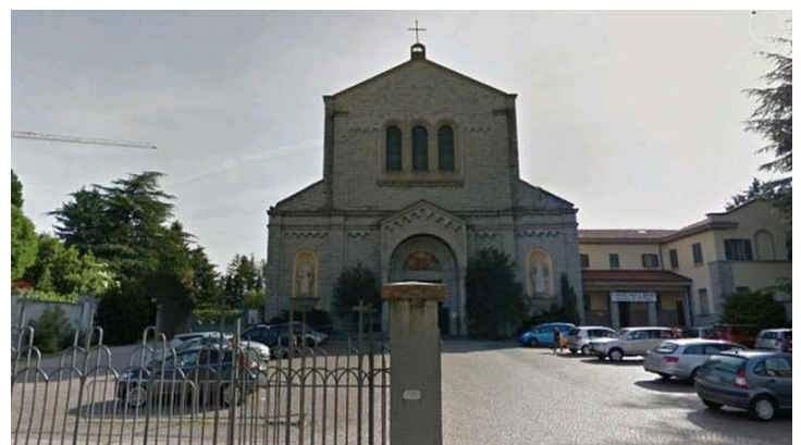
La chiesa dei Cappuccini

La storia si farebbe lunghissima. Torniamo al titolo: vogliamo d'ora innanzi dire che andiamo a messa in San Francesco? Si pensi che negli anni Sessanta era ormai stabilito che le spoglie del Duca d'Este Francesco III dovevano essere trasferite dal cimitero monumentale di Giubiano proprio qui nella Chiesa dei Frati di San Francesco. In seguito non se ne fece nulla.