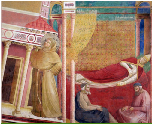
San Francesco ed il sogno di Innocenzo III, Giotto, Basilica di Assisi

ripone tutta la sua consistenza in Cristo. A San Giovanni, la grande basilica sorta nel IV secolo su una proprietà della famiglia dei Laterani, Mater et caput di tutte le chiese di Roma le cui quindici gigantesche statue si vedono anche dal Gianicolo,