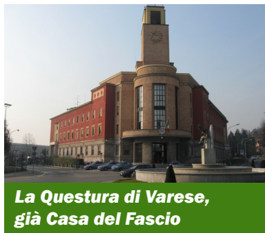
La Questura di Varese, già Casa del Fascio

È possibile, in questa vicenda della cittadinanza onoraria varesina concessa a suo tempo a Benito Mussolini, benemerenda di fatto confermata di recente dopo che il consiglio comunale ha respinto una mozione del PD che ne chiedeva la cancellazione, che il primo a rimanere sorpreso sia stato