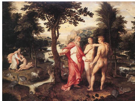
Jacob de Backer, Il Giardino dell'Eden , Bruges Groeningemuseum

torio più vicine ai luoghi di vita dei pazienti. La rete ospedaliera si riorganizza intorno a un modello differenziato che, accanto ad un numero limitato di centri di eccellenza dove si compiono gli interventi più difficili e costosi, vi sono ospedali periferici che si occupano delle operazioni meno complesse e indirizzano ai primi i casi che si fanno complicati. In pratica i pazienti non dovrebbero essere ricoverati solo in base alle loro patologie ma in relazione alla gravità della malattia e della complessità dei servizi di assistenza necessari. Invece delle decine di reparti accentrati in un unico plesso si punta su un triplice livello di strutture ospedaliere. Un primo livello di alta intensità di cura e di rianimazione; un secondo livello per i ricoveri ordinari di breve durata e un terzo livello riabilitativo per la media e lunga degenza dopo la fase acuta della malattia. Il ciclo di cure sarà coordinato da un “medico tutor” che segue il paziente, prepara il piano terapeutico e da un infermiere referente che lo supporta sino alla dimissione. In questo contesto, già in fase di attuazione da parte di alcune