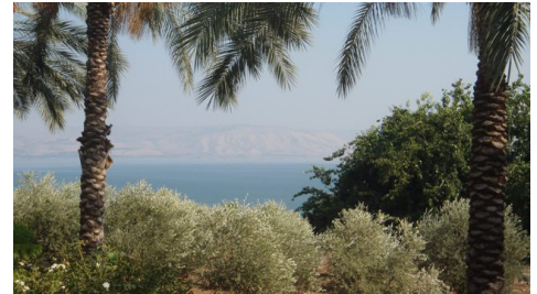
Il lago di Tiberiade dal Monte delle Beatitudini

Vi sono grato, pescatori, il monte delle Beatitudini è sentiero di vita.