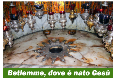
Betlemme, dove è nato Gesù

Se ripartiamo da lui, Gesù Figlio di Dio, le nostre vite, le nostre vicende non sono né piccole né inutili; i nostri affanni non sono insuperabili dal momento che lui se ne è fatto carico nascendo a Betlemme. Colui che c'è da sempre, che per bocca dei nostri genitori ci ha chiamato per nome e con amore fin da quando siamo nati e nel Battesimo, è all'origine di tutto e possiamo ricominciare con fiducia e con speranza la nostra vita proprio ripartendo da lui.