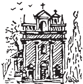
MONELLI DELLA MOTTA