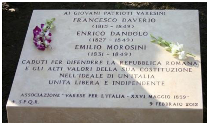
La lapide al Gianicolo in ricordo dei patrioti varesini