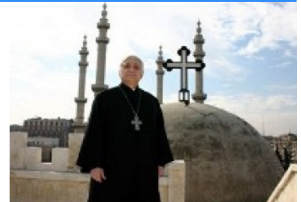
monsignor Antoine Audo, vescovo di Aleppo

“Il popolo desidera la pace, questa guerra serve solo ai nemici della Siria, a chi vuole farne terreno di conquista. Purtroppo l'opinione pubblica occidentale non è messa in condizioni di capire cosa accade realmente da noi, anche perché i mass media propongono una rappresentazione deformata della realtà. Ad esempio c'è stata una grande enfasi sulla violenta offensiva scatenata dall'esercito per liberare la Ghouta dal controllo dei ribelli, tacendo sul fatto che era la risposta agli attacchi missilistici che da mesi colpivano molti quartieri di Damasco. Dobbiamo essere realisti, dopo sette anni di guerra: oggi chi può garantire una Siria unita è di fatto solo il Governo”. Ma a quanto pare Trump, May e Macron non sono interessati alla pacificazione della Siria e al destino del popolo siriano.