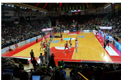
Una partita al Palazzetto di Varese

N ei giorni scorsi un arbitro di calcio della sezione di Legnano con un erroraccio – inversione di un fallo che è costato un rigore - partita alla Reggiana che conteneva al Siena la promozione dalla D alla C- mi ha ricordato che assieme all’ampio e variegato mondo della politica regionale, da anni annaspava pure il calcio lombardo che poco o nulla ha combinato di buono a cominciare dalle sue due grandi ex vedette, per lungo tempo dominatrici anche nel pianeta europeo e mondiale dello sport più seguito e giocato. Non voglio affrontare la questione arbitrale né la sfortunata esibizione del Carneade legnanese, ma statisticamente sarebbe rilevante sapere da quanto tempo Milano non ha più arbitri degni della serie A mentre non hanno di certo brillato come stelle quelli regionali ai quali i poteri tecnici e politici hanno concesso il palcoscenico più prestigioso. Citare la povertà arbitrale e accostarla ai tanti problemi lombardi di questi decenni non è un rilievo fuori luogo, è semplicemente fare una puntualizzazione cronistica che peraltro non può prescindere da una constatazione di base: non ci sono più tanti giovani che si accostano a una attività sportiva delicata e importante come l’arbitraggio calcistico, che richiede doti fisiche, lucidità anche dopo 90 minuti di corsa, senso di responsabilità.