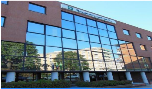
La sede della Regione Lombardia a Varese

tà pubblica. Un silenzio, una viltà politica che hanno visto complici ideologi ed esecutori degli ordini: tradito un intero popolo che nutriva in tutti loro grande fiducia.