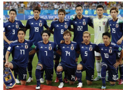
La nazionale del Giappone

Il complesso d'inferiorità che ci condiziona nel rapporto col resto del mondo, amplificato ogni giorno dalla sciagurata psicologia d'una mediocre classe politica, lo si supera soltanto pensando in positivo. Non certo atteggiandosi al contrario. Farò meglio di te perché ho più idee, talento, energia; non perché spero che tu ne dimostri di meno. Il vangelo laico innalzato ogni tanto sul podio di qualche comizio dovrebbe essere tale e non altro. È così che si vince la gara della modernità, altrimenti ridotta a una corsa a handicap in cui anche chi prevale lo deve ai demeriti degli avversari anziché ai meriti suoi. Nello sport non funziona a questo modo. Nella vita di ogni giorno idem. Se vogliamo chiamarla per davvero vita.