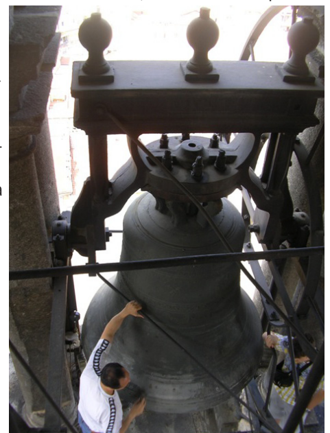
Il campanone di san Vittore