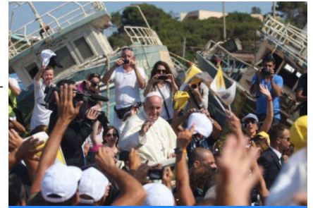
Papa Bergoglio a Lampedusa

La migrazione è un fattore storico, matematicamente statistico, che scatta in presenza di certi fattori, come per esempio la carestia o le guerre che la generano. Fenomeni antichi già descritti anche nella Bibbia ed in altri testi o poemi del passato. Va bene tutto, ma che cosa è questa carità? Semplicemente una virtù teologale? È codificata come tale ma non deve restare sulla carta dei catechismi. Va vissuta e realizzata con azioni positive per se stessi e per gli altri. Una virtù saggia non solo di fede, ma laica, assolutamente laica, vigorosa, determinata, generosa, aperta a tutti. Non passiva ma reciprocamente stimolante, sia per i popoli ospitanti che per quelli migranti. Solo gli intelligenti sanno creare questa carità, negata agli stupidi, ai pusillanimi, ma anche ai furbi, calpestata dai criminali mafiosi, dagli speculatori, dai politici di parte, dagli egoisti. Semplice questa laicità? No! Difficilissima come dimostrano le politiche nazionali e globali che stiamo vivendo.