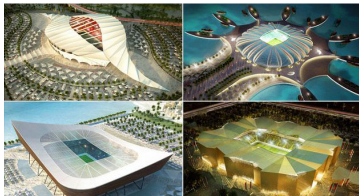
Avveniristici progetti per Qatar 2022

Eppure, nonostante il silenzio dei vertici della massima istituzione calcistica e della monarchia qatariota (non esattamente un modello quanto a democrazia e tutela dei diritti umani), a muoversi tra i primi sono stati alcuni premi Nobel richiedendo giustizia per gli operai costretti a lavorare senza poter avere accesso all'acqua potabile gratuita, a pasti decenti e obbligati ad abitare