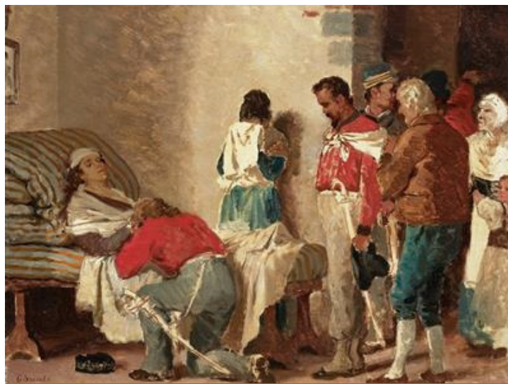
La morte di Anita Garibaldi