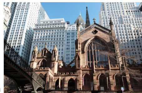
Trinity Church a New York