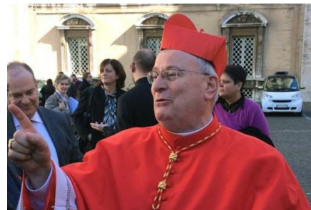
Il cardinal Gualtiero Bassetti

E allora un impegno concreto e responsabile, il mettere in rete le esperienze e le proposte, l'essere il sale della terra, sono tutti elementi che portano a ritenere che una Dc 2.0 non sia solo un'affascinante utopia. Ma, per favore, non fermiamoci a discutere se debba essere un partito "di" o "dei" cattolici.